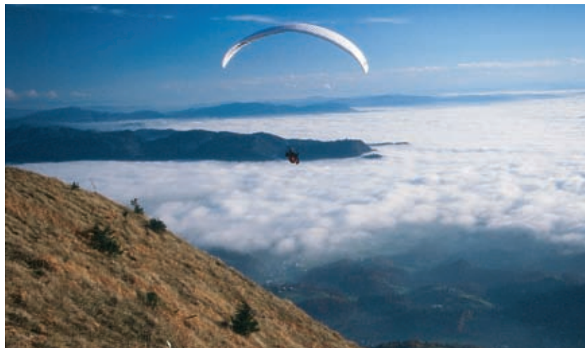
Kamniški vrh je priljubljeno vzletišče jadralnih padalcev.

srečali ob tu in tam strmem vzponu, le izletnike, ki ob koncih tedna radi obiskujejo Kamniški vrh, porazgubljeni po njegovih številnih poteh; zlato pa bo sonce, ki se prijetno upira v prisoje, in satanske bodo oblike skal ali drevesnih debel, skrotovičenih od plazov. Do vrha ni niti preblizu niti predaleč.