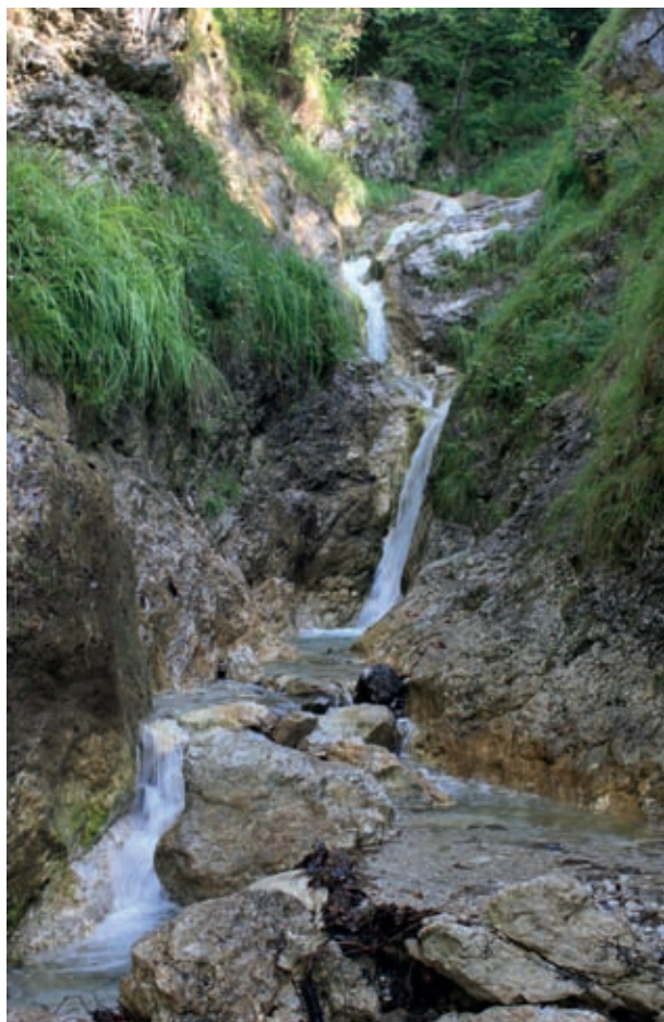
Brzice in slapičja potoka Korošak

Široko pleče Kamniškega vrha ni razjedeno samo z Rožo, ampak je proti zahodni, krvavški strani zarezano še s kakšno grapo; najznačilnejšo,