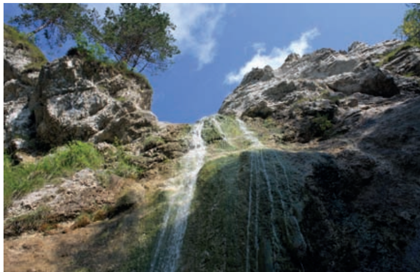
Zgornji slap na Korošaku. V sušnem vremenu si komaj zasluži svoje ime. Nad ta slap se je nevarno povzpeti, najlepše ga je opazovati kar od spodaj.

k naslednjemu slapu, ki pada kmalu za največjim oziroma nad njim. Za hip in od daleč ga lahko vidite tudi malo pod Koštarjevim slapom. Če ste malo plezalca, lahko do njega zlezete po grušču, razvlaženem od vode, ki se solzi iz njega, do skalne pregrade, se prekobalite čez njo in že ob vodi, ki se vklenjena v skalovje tu in tam sprošča v iskrnih skočnikih, pridete do nove postaje lepote, da bi tam občudovali kiparko naravo in njeno dleto – potok. Gornji slap je visok okoli 10 metrov. Tudi ta se ustavlja na mahu in vztrajno poskuša razčesati njegovo židko temno grivo.